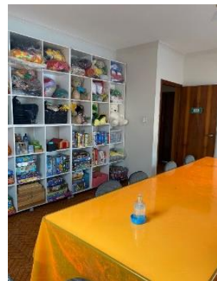
Sala de Multimídias