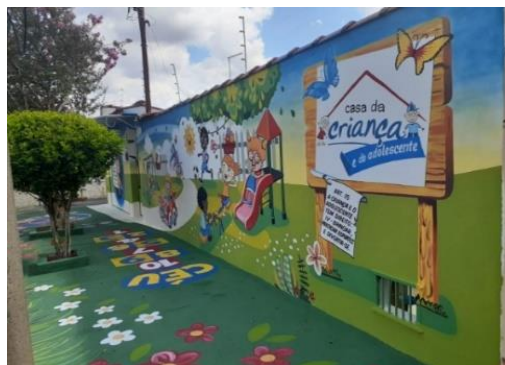
Fachada da Instituição