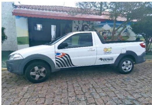
Veículo da Instituição

Reconhecida como Utilidade Pública Municipal. Registrada no CMDCA - Conselho Municipal dos Direitos da Criança e do Adolescente. Inscrita no CMAS – Conselho Municipal da Assistência Social com o serviço de convivência e fortalecimento de vínculos para crianças e adolescentes. Cadastrada no PRÓ-SOCIAL – SEADS/PS. Inscrita no CEE – Cadastro Estadual de Entidades.