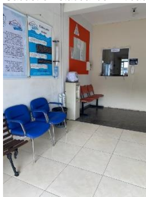
Sala de Espera