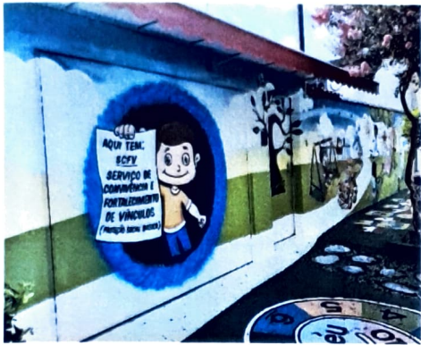
Fachada da instituição

Reconhecida como Utilidade Pública Municipal. Registrada no CMDCA - Conselho Municipal dos Direitos da Criança e do Adolescente. Inscrita no CMAS – Conselho Municipal da Assistência Social com o serviço de convivência e fortalecimento de vínculos para crianças e adolescentes. Cadastrada no PRÓ-SOCIAL – SEADS/PS. Inscrita no CEE – Cadastro Estadual de Entidades.