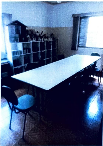
Sala de Múltiplos Usos