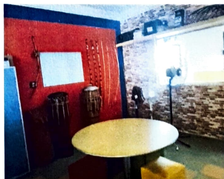
Sala de Equipamentos