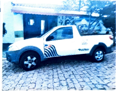
Veículo da instituição